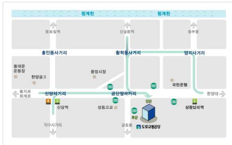
서울특별시 중구 왕십리로 407 (신당5동 171)

약수사거리에서 신당사거리 방향으로 직진 → 신당사거리에서 우회전 → 첫번째(공단앞사거리)에서 직진 → 공단